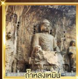
ถ้ำหล่งหมื่น