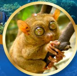
ลิงทาร์เซีย