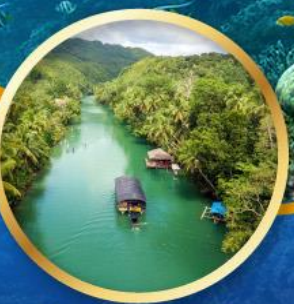
ล่องเรือแม่น้ำโลบ็อก