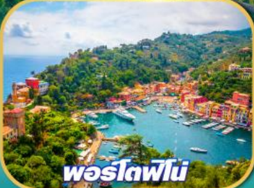
โพร์โตฟินี