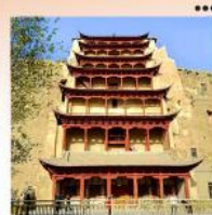
ท่าม่อเถา

17-24 ส.ค. 69 32,900 24-31 ส.ค. 69 32,900 31 ส.ค.-07 ก.ย. 69 33,900 14-21 ก.ย. 69 31,900 12-19 ต.ค. 69 32,900