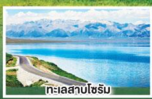
ทะเลสาบไซรัม