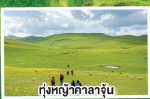
ทุ่งหญ้าคาลาจูน