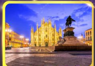
มหาวิหารคูโอโม