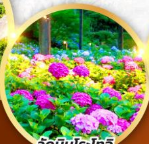
วัดมิมุโระโทจิ