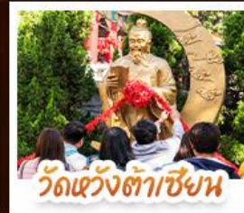
วัดเซ้งต้าเซียง