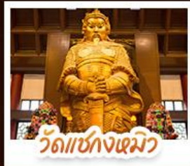
วัดเซ้งกงเมว