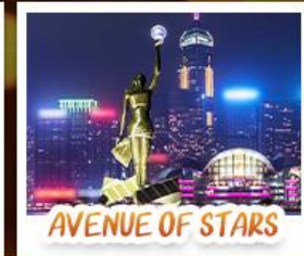
AVENUE OF STARS