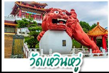
วัดเหวินหลู