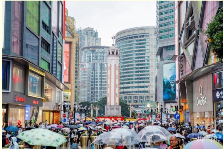
ถนนคนเดินเจี๋ยฟางเป่ย์

และนำท่านไป ถนนคนเดินเจี๋ยฟางเป่ย์ (Jiefangbei Street) ตั้งอยู่บริเวณอนุสาวรีย์ปลดแอก ซึ่งสร้างขึ้นเพื่อรำลึกถึงชัยชนะในการทำสงครามกับญี่ปุ่น แต่ปัจจุบันกลายเป็นศูนย์กลางทางการค้าขนาดใหญ่ ใจกลางเมือง เต็มไปด้วยร้านค้ามากกว่า 3,000 ร้าน ซึ่งมีทั้งอาหาร ซ้อปิ้ง มอลล์ขนาดใหญ่ ให้ท่านได้เดินชมและซ้อปิ้งกันอย่างจุใจ.