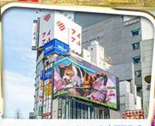
เที่ยวเกาะแอมว ไอโนะชิมะ ตามรอยซีรีส์ชื่อดัง CAN THIS LOVE BE TRANSLATED?

ขายดี เปิดพีเรียดเพิ่ม! ราคาเพียง 19,999 *รวมภาษีมูลค่าเพิ่มแล้ว*