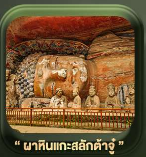
" พาทินแกะสลักต้าจู้ "