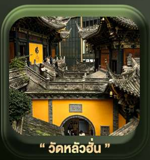
" วัดหลิวอัน "