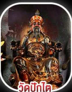
วัดบิกไค