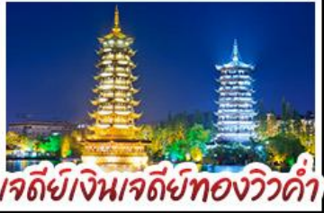
เจดีย์เงินเจดีย์ทองวิวค้ำ

หมู่บ้านแม่ว้ซีเจียง - เาหรุอี้ - กุหลาบพันปี เมืองปี้เจียง เางวงซ้าง - เอดีย้เงินเจดีย์ทองวิวค้ำ - เาหรุอี้ ซ้อป้ึงกับถนนคนเดิน ซี้ซียง - ซี้เจียง เมนูพิเศษ บุฟเฟ่ต์ชาบูซีฟู้ด ปลาอบเบียร์ เผือกคริสตล สุกี้เห็ด