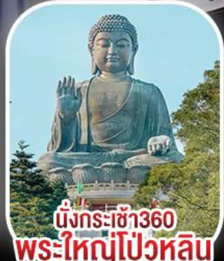
นั่งกระเช้า360 พระใหญ่โป้วหลิน