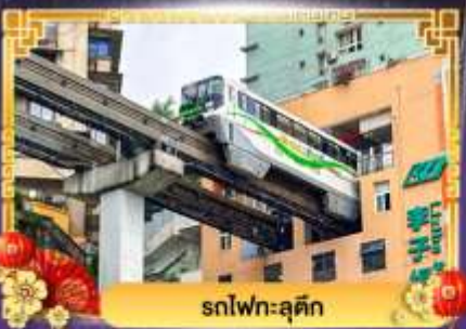
รถไฟฟ้าชุนชิ่ง