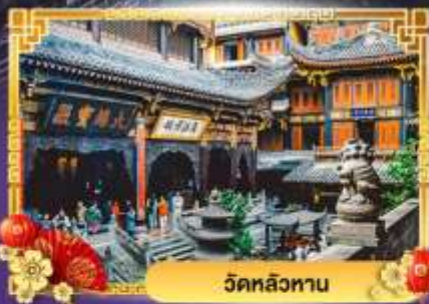
วัดหลิวทาน