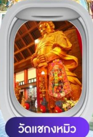
วัดฯชางหมิว