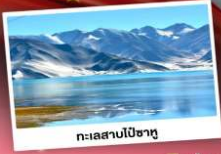
ทะเลสาบไปซาทุ

เปิดประตูสู่อารยธรรมพันปีแห่งซินเจียงใต้ ชมความสวยงามของหมู่บ้านดอกแอปเปิล