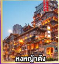
ทงทงต้าตั้ง