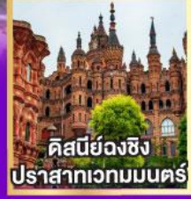
ดิสเนย์วงชิง ปราสาทเวทมนตร์