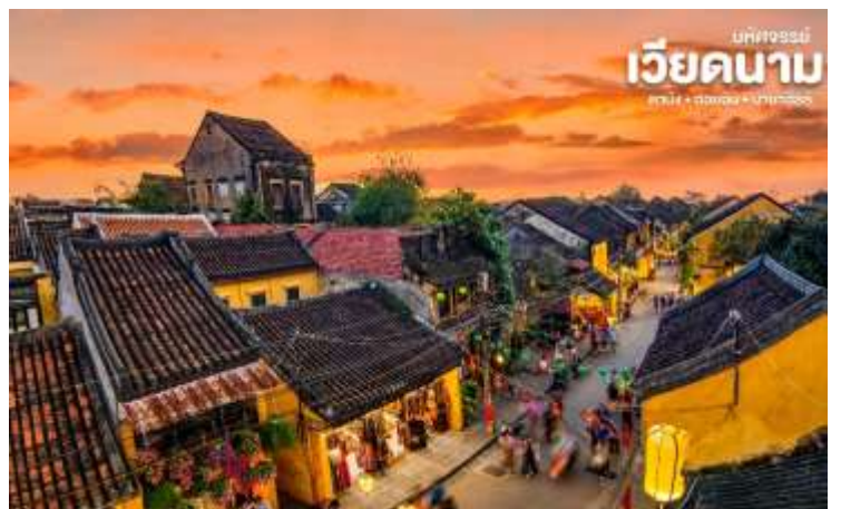
บทวิจารณ์ เวียดนาม ดาบิง • ฮอยอัน • บานาฮิลล์

พิธีสมัยโบราณ คือ การนำรูปที่ขีดเป็นก้นหอย มาจุดทิ้งไว้เพื่อ เป็นสิริมงคลแก่ท่าน