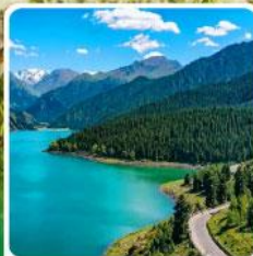
อุทยานเทียนชาน เทียนฉือ