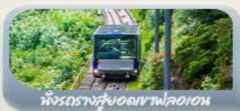
นั่งรถรางสวยยอดเขาฟลอรอน