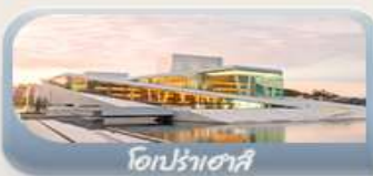
โอปราเฮาส์

11-19 มิ.ย. 69 / 23-31 ก.ค. 69 / 05-13 ส.ค. 69 03-11 ก.ย. 69 / 24 ก.ย.-02 ต.ค.69