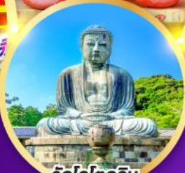
วัดโคโคคุอิน