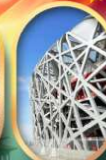
จัสมุทรีสเกี้ยนอันเหิน