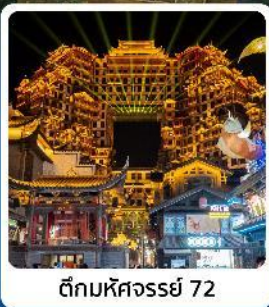
ตึกหอคจวรรษ 72