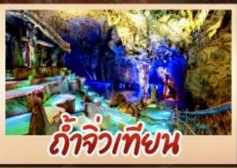
ถ้ำจิวเทียน