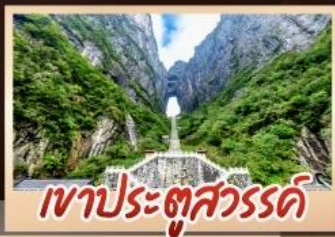
เขาประตูลสวรรค์