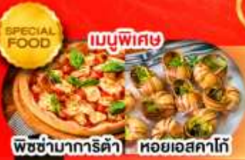
พิซซ่านาการิต้า หอยยอสคาโก้