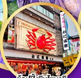
ซ้อปั้งชินโซบาช