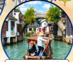
เมืองโบราณจูเจียเจีย