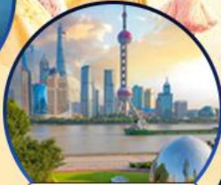
นอร์ทบิ้น กรีนแลนด์