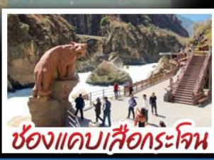
ช่องแคบเสือกะโจน