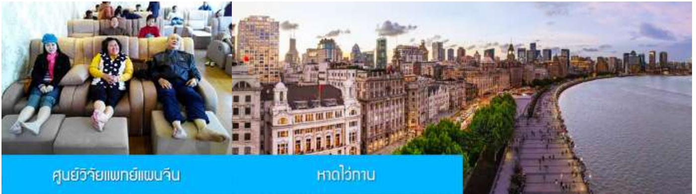
ศูนย์วิจัยแพทยแผนจีน