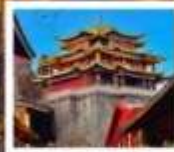
วัดสาม-ซงจ้านหลิง