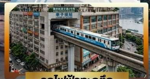
รถไฟฟ้าทะลุติ๊ก