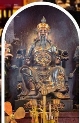
วัดปักโต

ขอเทพเจ้ากวนอู ความซื่อสัตย์ เงินทอง ธุรกิจมั่นคง