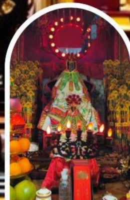
วัดเจ้าแม่กวนอิมฮ่องฮำ

เสริมโชคกลางนำความรุ่งเรืองทุกด้านของชีวิต