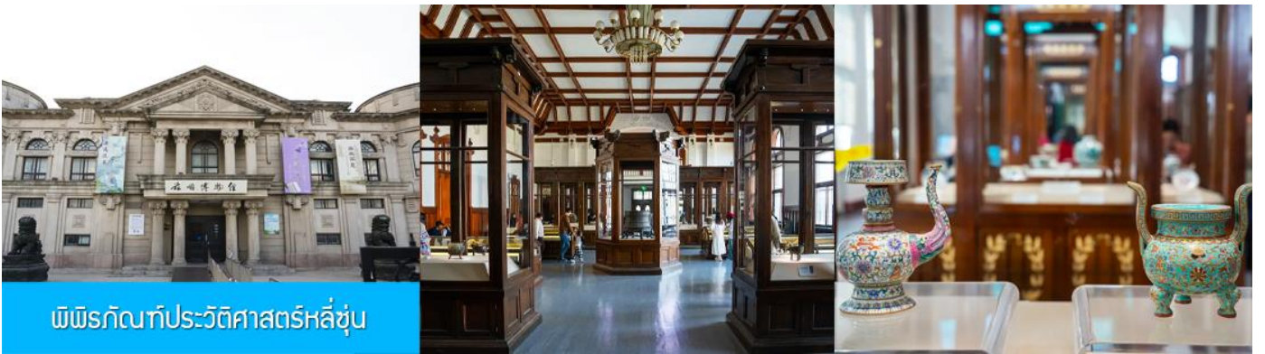
พิพิธภัณฑ์ประวัติศาสตร์หลี่ซุ่น

นำท่านเที่ยวชมและเก็บภาพ ณ สถานีรถไฟหลี่ซุ่น 旅顺火车站 เป็นสถานีปลายทางของเส้นทางรถไฟสาขา เลิ่นหยาง - ต้าเหลียน สร้างขึ้นในปีค.ศ. 1903 ออกแบบโดยสถาปนิกชาวรัสเซีย เป็นอาคารอิฐก่อปูนผสม โครงสร้างไม้ตามสถาปัตยกรรมรัสเซีย.