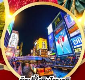
ช้อปปิ้งชินโซบาช