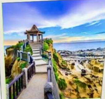
อุทยานเกาะเหอผิง