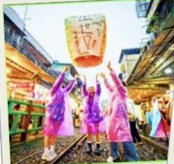
ปล่อยโคมลอย