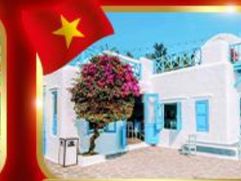
คาเฟ่สุดชิค ซานทรา มารีน่า