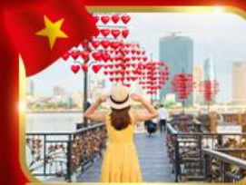
เช็กอินสะพานแห่งความรัก