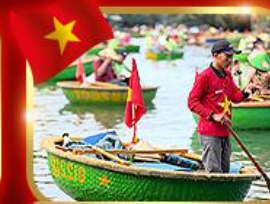
เรือกระด้ง หมู่บ้านกัมทาน