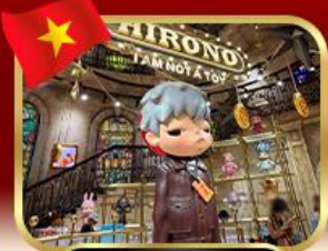
popmart บานาฮิลล์