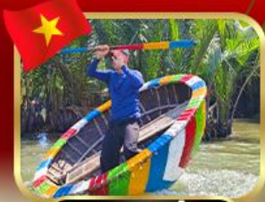
ล่องเรือกระด้งที่มณฑล