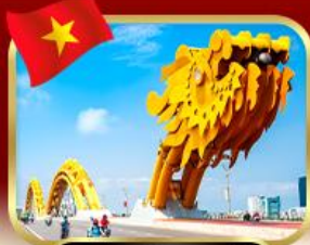
สะพานมังกร ดำนัง