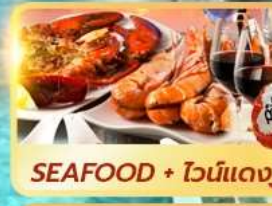
SEAFOOD + ไวน์แดง