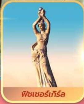
พีชเซอร์เก็รล