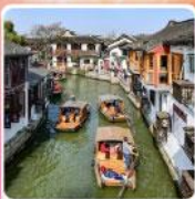
หมู่บ้านโบราณซูเจียเจี๋ย