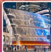
เรือหลุยส์