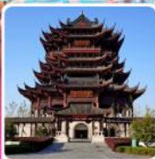
วัดดงหยวน