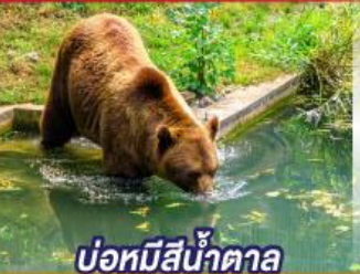
บ่อหมีสีน้ำตาล