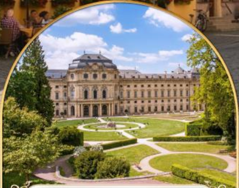
พระราชวังเวร์ทซ์บวร์ค เรสซิเดนซ์