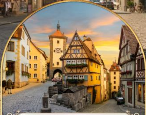
เพลินไลน์