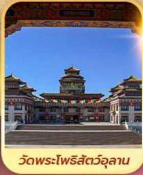
วัดพระโพธิสัตว์อูลาน