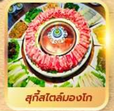
สุกีสโตล์มองโก