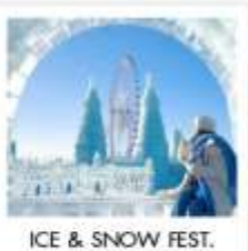
ICE & SNOW FEST.