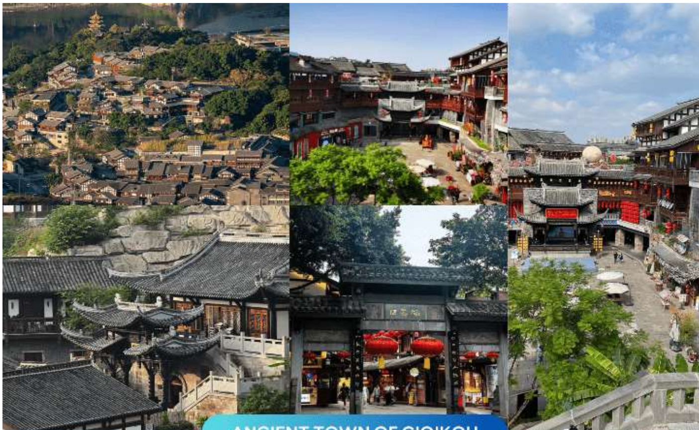
ANCIENT TOWN OF CIQIKOU

นำท่านสู่ หมู่บ้านโบราณฉีไซ่ชว่ (Ancient Town of Ciqikou) เป็นหมู่บ้านอนุรักษ์ทางวัฒนธรรมที่มีชนเผ่ากลุ่มน้อยหลากหลายเชื้อชาติอาศัยอยู่ อาคารบ้านเรือนภายในหมู่บ้านคงรูปแบบของสถาปัตยกรรมจีนดั้งเดิมไว้ ซึ่งให้เราได้สัมผัสกลิ่นอายย้อนยุคสมัยราชวงศ์ซ่ง หมิง และชิง พร้อมกับเลือกซื้อของที่ระลึก หรือของฝาก