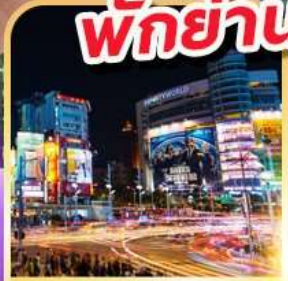
ย่านซิเหมินตึง