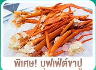
พิเศษ! บุฟเฟ่ต์ขาปู