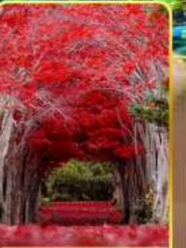
สวนฮิราโอกะ