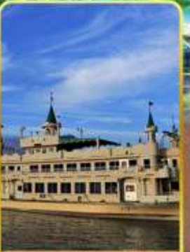
ล่องเรือทะเลสาบโทยะ