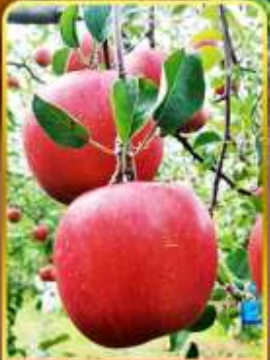
เก็บแอปเปิล