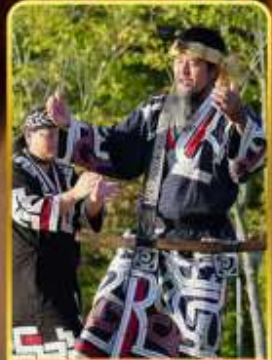
พิพิธภัณฑ์โอนู