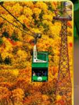
กระเช้าโรดาคะ

🔥 ออนเซ็น 3 คั้น 🧳 มน.กระเป๋า 23 กก. 🌞 7Days 5Night